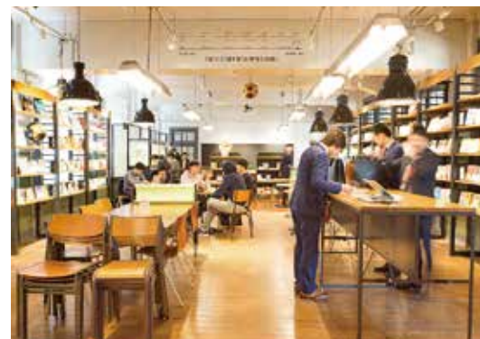
福岡市スタートアップカフェ

創業を志す方をサポートするため、中小企業診断士や税理士、司法書士などの専門家に、起業の準備や相談ができる空間。多種多様な人たちが集い、新しい価値を生み出すプラットフォームを整備します