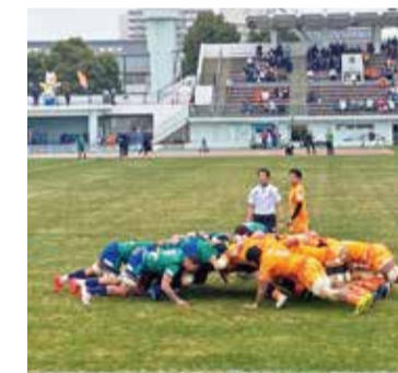
NECグリーンロケッツ東葛